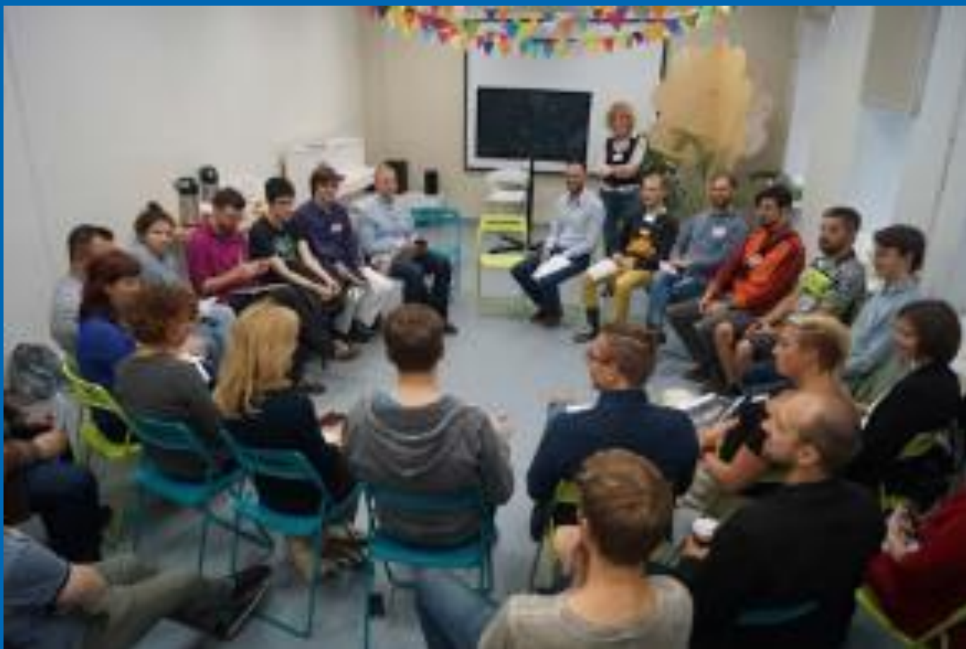
Заседание бюджетной комиссии в Санкт-Петербурге Budgeting committee meeting in St. Petersburg

В итоге, партиципаторное бюджетирование оказывает влияние на развитие публичного языка, необходимого для развития гражданского общества