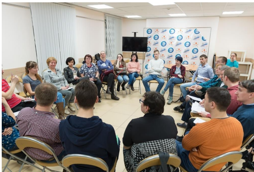
Заседание бюджетной комиссии

Санкт-Петербург стал первым городом федерального значения, в котором реализуется инициативное бюджетирование. Организатором проекта выступил Комитет финансов Санкт-Петербурга. Особенность применяемой в Санкт-Петербурге методологии в том, что распределение части средств городского бюджета проводится в рамках бюджетных комиссий, формируемых через публичные жеребьевки из числа горожан, подавших заявку на участие. Другой особенностью является возможность организаторам найти и реализовать нестандартные, не очевидные для властей идеи горожан.