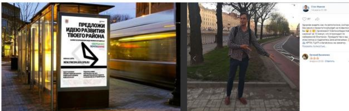
Автор и его реализованный проект

Голосованию бюджетной комиссии по поводу приоритетных направлений расходования бюджетных средств предшествует двухмесячный образовательный курс, в рамках которого проходят встречи с представителями различных департаментов, специалистами районных администраций, городскими экспертами. Данный формат просвещения обеспечивает возможность ввести участников бюджетных комиссий в круг вопросов органов государственной власти и особенностей организации городского управления в Санкт-Петербурге, позволяет горожанам иметь более профессиональные суждения по поводу того, какие проекты могут быть поддержаны в рамках проекта и усовершенствовать свои проектные идеи до уровня проектных заявок.