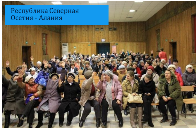
Республика Северная Осетия - Алания